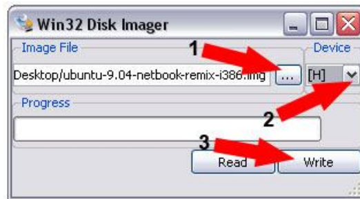
Gambar 2. Tool Disk Imager digunakan untuk menyalin image ke USB